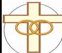
Sacrament of Marriage

Interested?? Please call the rectory at 718-451-1500 and leave your name, phone number, email address or email at: sttheresereled@hotmail.com